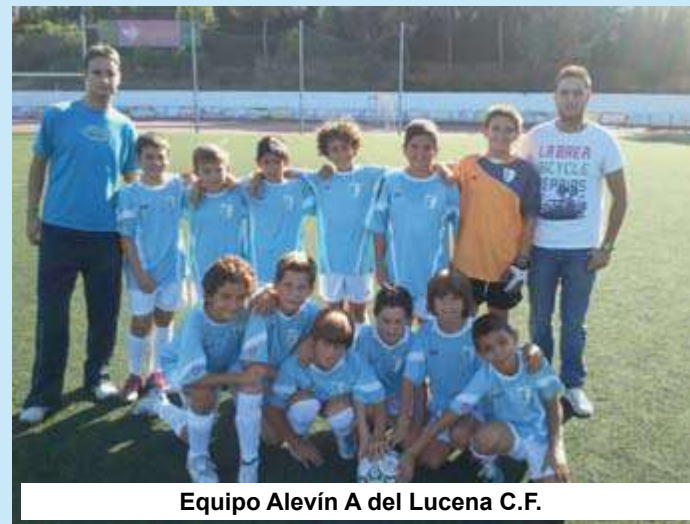
Equipo Alevín A del Lucena C.F.

que ya la temporada pasada conseguimos con el ascenso de categoría del benjamín o la participación en la liguilla de ascenso a Liga Nacional del juvenil, además de que llevamos dos temporadas en las que no ha habido ningún descenso. -¿Qué les dirías a los padres de los jugadores de los equipos de la cantera? Sabemos que todo el mundo no puede estar contento, ya que son muchísimos niños los que tenemos en la cantera, y le diría a los padres que la misma ilusión que tienen ellos porque sus hijos sean futbolistas, la tenemos nosotros. A mí me encantaría que, cuando pasen unos años, en el once titular del primer equipo del Lucena CF hubieran seis o siete jugadores de nuestra ciudad. Ya el año pasado debutaron algunos jugadores lucentinos de la cantera en 2ª B, y este año contamos con siete jugadores de Lucena en la primera plantilla del equipo y que seguro que contarán con minutos a lo largo de la temporada. -¿Te gustaría añadir algo más? Sí, se está trabajando con niños desde cuatro años hasta los mayores del senior para que todos tengan el mismo modelo de juego y que en un futuro, los podamos debutar con el primer equipo o en equipos de categorías superiores.