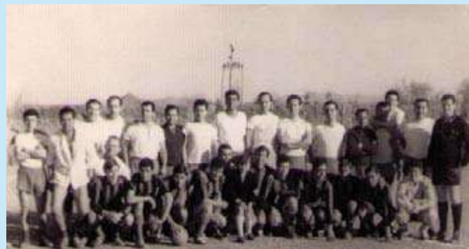
Los jugadores del At. Lucentino se enfrentaron a las viejas glorias de la U.D. Lucentina